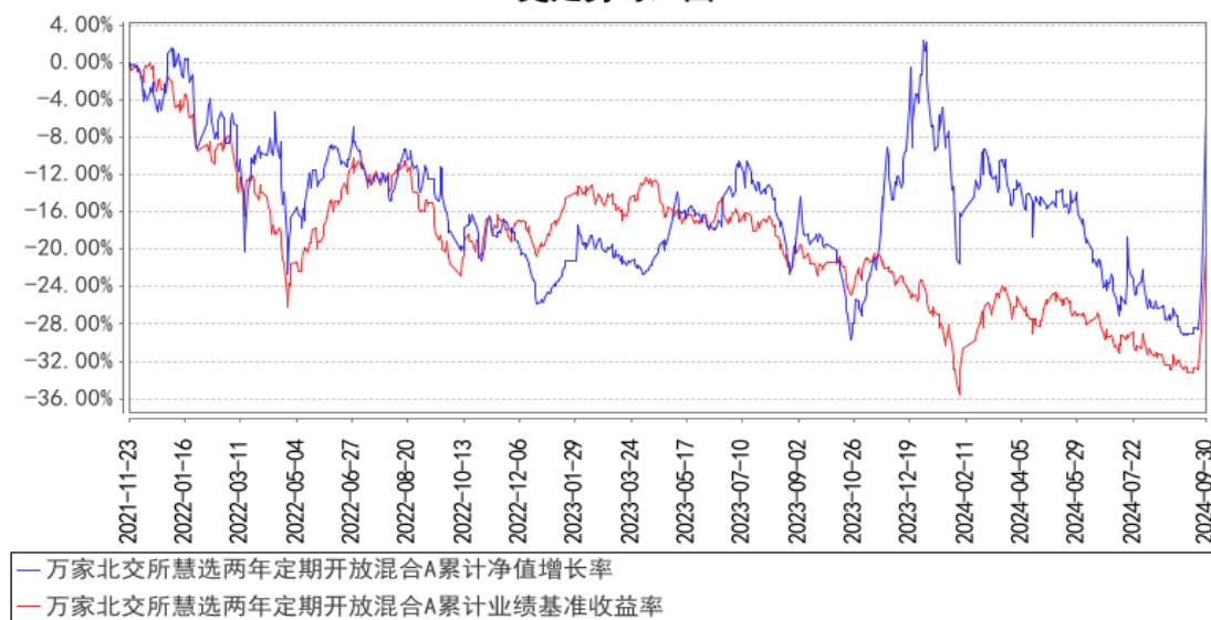
万家北交所慧选两年定期开放混合A累计净值增长率与同期业绩比较基准收益率的历史走势对比图